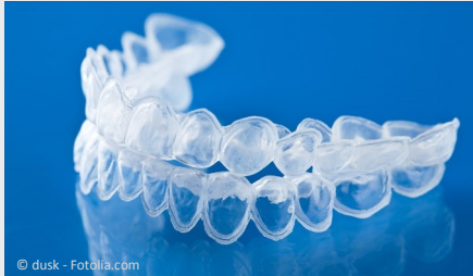
Bleaching-Form aus Kunststoff, in die Sie das Aufhellungs-Gel einfüllen.

Beim Home-Bleaching werden vom Zahnarzt dünne flexible Formen aus einem transparenten Kunststoff hergestellt, die genau